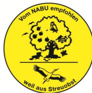
NABU-Qualitätszeichen für Streuobsterzeugnisse

Fachliche Beratung: Erik Kubitz, NABU-Naturschutzstation Schloss Heynitz, Heynitzer Str. 9, 01683 Nossen OT Heynitz, 035244 / 498870, kubitz@NABU-sachsen.de , https://naturschutzstation-heynitz.NABU-sachsen.de