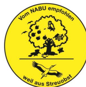
NABU-Qualitätszeichen für Streuobsterzeugnisse