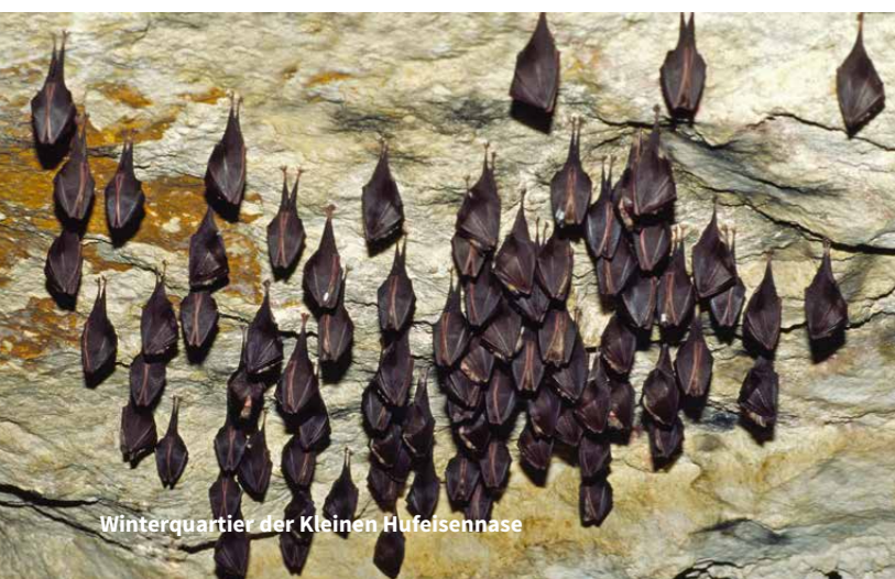
Winterquartier der Kleinen Hufeisennase

Es ist verboten, Höhlen, Stollen, Erdkeller oder ähnliche Räume, die als Winterquartier von Fledermäusen dienen, in der Zeit vom 1. Oktober bis zum 31. März aufzusuchen; dies gilt nicht zur Durchführung unaufschiebbarer und nur geringfügig störender Handlungen sowie für touristisch erschlossene oder stark genutzte Bereiche.