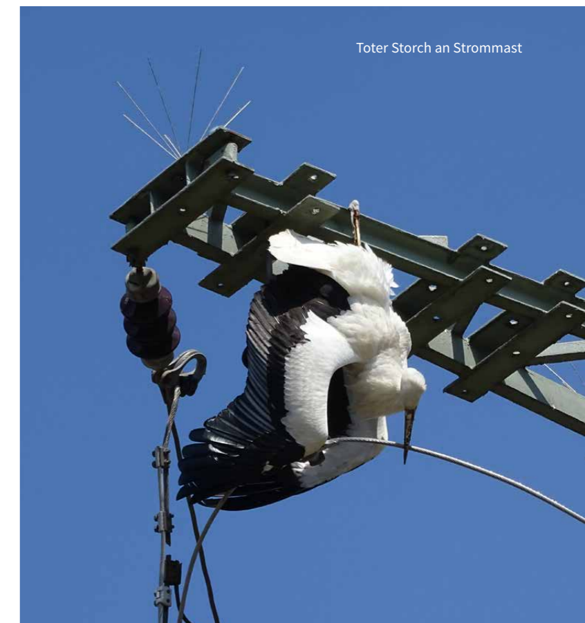
Toter Storch an Strommast