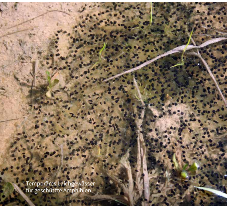
Temporäres Laichgewässer für geschützte Amphibien

also die kontinuierliche ökologische Funktionalität von Fortpflanzungs- und Ruhestätten sicherstellen.