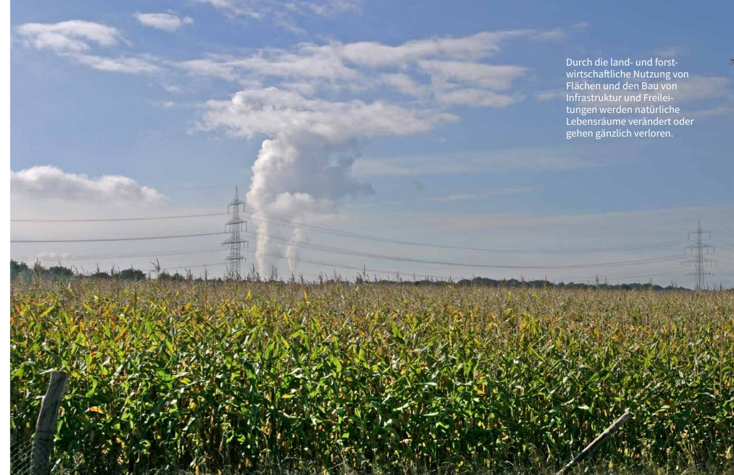
Durch die land- und forstwirtschaftliche Nutzung von Flächen und den Bau von Infrastruktur und Freileitungen werden natürliche Lebensräume verändert oder gehen gänzlich verloren.