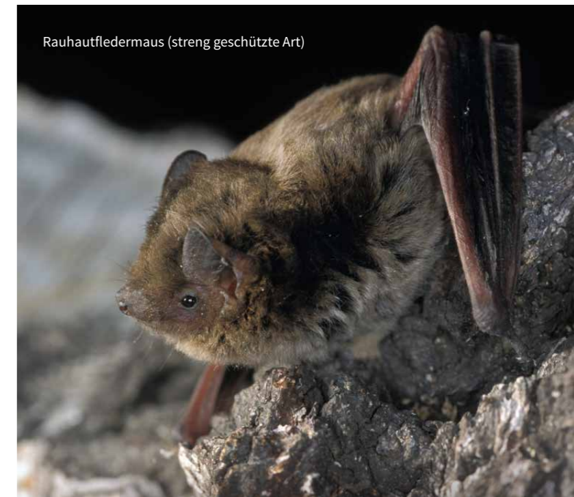
Rauhautfledermaus (streng geschützte Art)

Für den Fall, dass eine Handlung gegen die Verbote in § 44 BNatSchG verstößt, prüft die zuständige Behörde, sofern ein entsprechender Antrag gestellt wird, ob im Einzelfall eine Befreiung von den artenschutzrechtlichen Verboten erteilt werden kann. Die Voraussetzungen hierzu ergeben sich aus § 67 Abs. 2 BNatSchG . Bei einer richtlinienkonformen Anwendung des § 67 Abs. 2 BNatSchG kommt jedoch die Erteilung einer