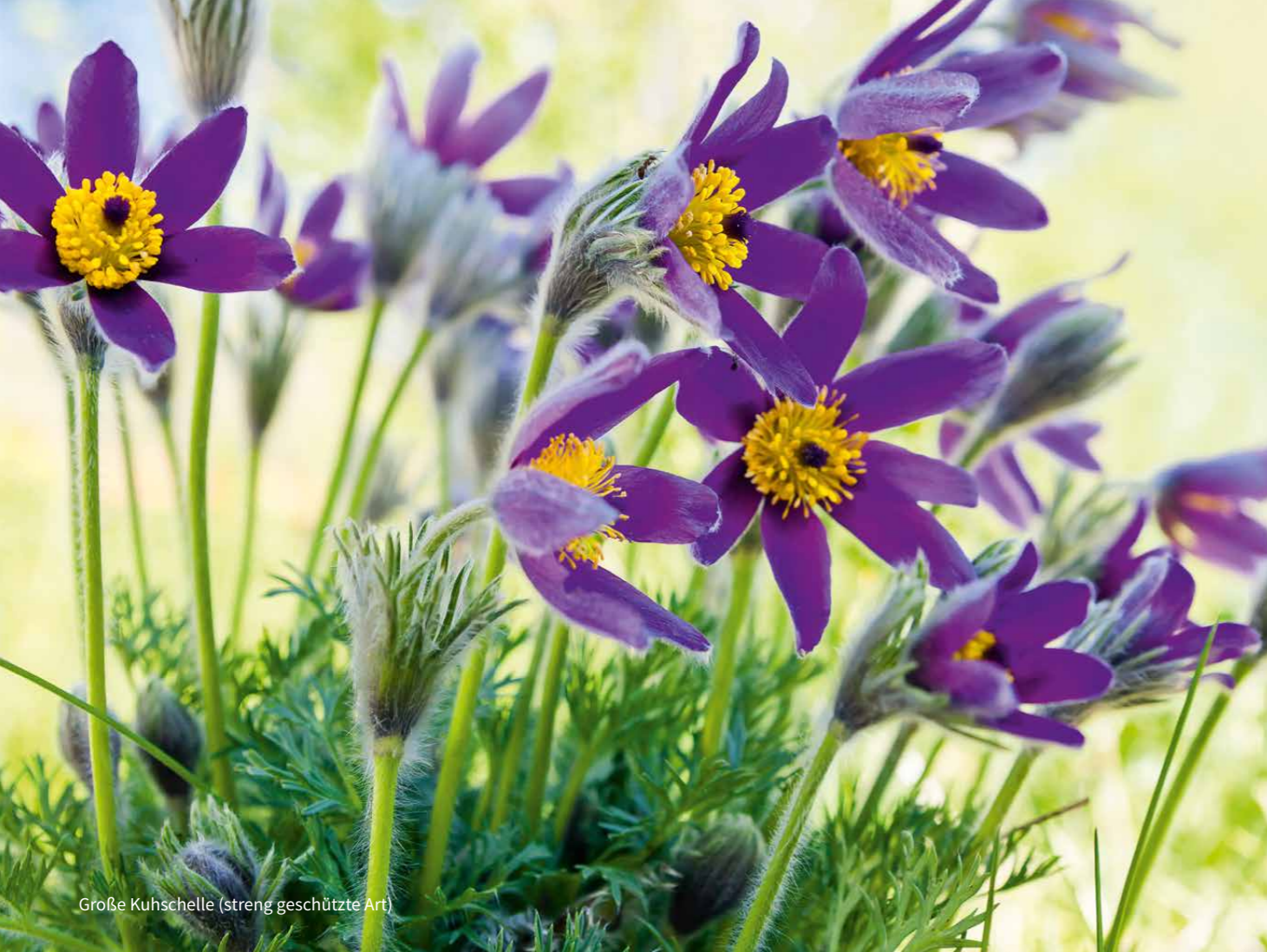
Große Kuhschelle (streng geschützte Art)