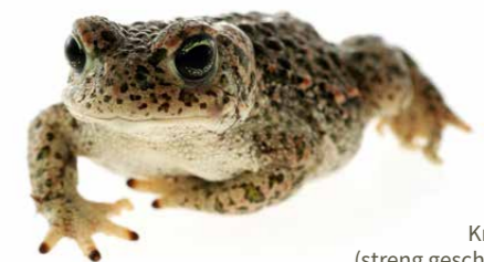
Kreuzkröte (streng geschützte Art)