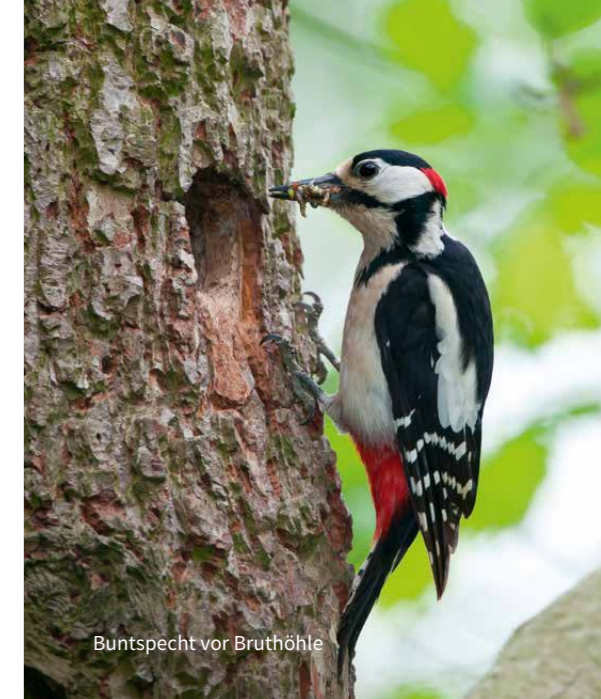
Buntspecht vor Bruthöhle

Ab- oder Einsammeln der Tiere, das Umsetzen/ Umsiedeln der Tiere unter Erhaltung der ökologischen Funktion der Fortpflanzungs- und Ruhestätte. Die Maßnahmen müssen laut Gesetzesbegründung entsprechend den fachlichen Standards und Sorgfaltspflichten durch qualifiziertes Personal durchgeführt werden. Freigestellt von den Zugriffsverboten sind die mit der Ausführung der Maßnahmen verbundenen Beeinträchtigungen, soweit sie nicht vermieden werden können. Entscheidend ist, dass die mit der Durchführung der Maßnahmen verbundenen Beeinträchtigungen der Tiere zeitlich beschränkt sind und mit dem Abschluss der Maßnahmen enden.