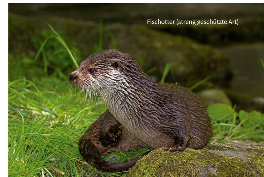
Fischotter (streng geschützte Art)

Das „Neue Helgoländer Papier der Länderarbeitsgemeinschaft der Vogelschutzwarten (LAG VSW) aus dem Jahr 2015 berücksichtigt den neuesten Forschungsstand zur Gefährdung von Vögeln durch