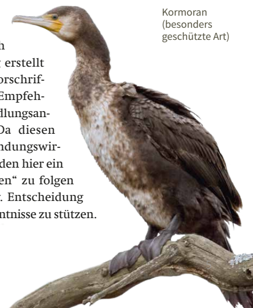
Kormoran (besonders geschützte Art)

Von den Verwaltungsvorschriften zu unterscheiden sind Veröffentlichungen – teilweise auch von der Naturschutzverwaltung erstellt –, die zwar keine Verwaltungsvorschriften sind, aber gleichwohl als „Empfehlungen“, „Leitfaden“ oder „Handlungsanleitung“ bezeichnet werden. Da diesen Vorgaben keine so genannte Bindungswirkung zukommt, bleibt den Behörden hier ein Spielraum, diesen „Empfehlungen“ zu folgen oder sich bei ihrer Prüfung bzw. Entscheidung auf andere Grundlagen und Erkenntnisse zu stützen.