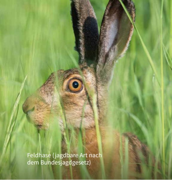
Feldhase (jagdbare Art nach dem Bundesjagdgesetz)