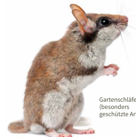
Gartenschläfer (besonders geschützte Art)

Grafiken (S. 12, 14, 21): Cskw Berlin, nach Vorlage des Landesbüro der Naturschutzverbände NRW GbR