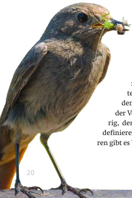
Hausrotschwanz (besonders geschützte Art)

Sind andere besonders geschützte Arten betroffen, liegt bei Handlungen zur Durchführung eines Eingriffs oder Vorhabens kein Verstoß gegen die Zugriffs-, Besitz- und Vermarktungsverbote vor.