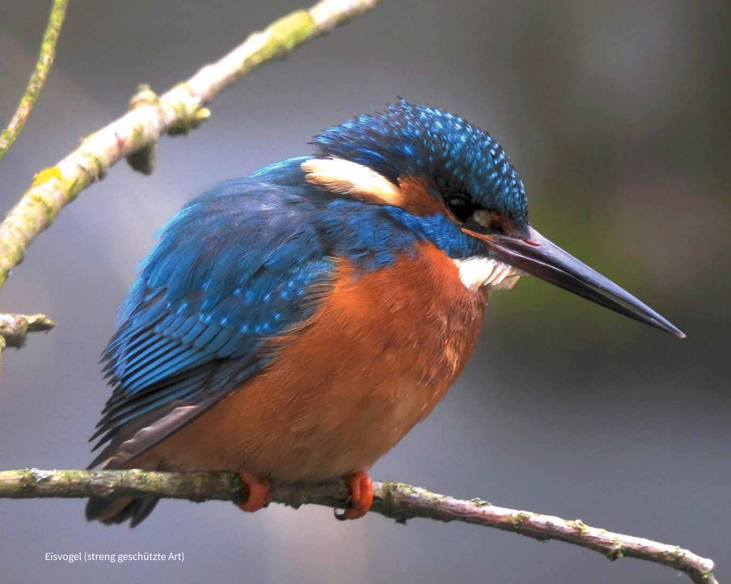
Eisvogel (streng geschützte Art)